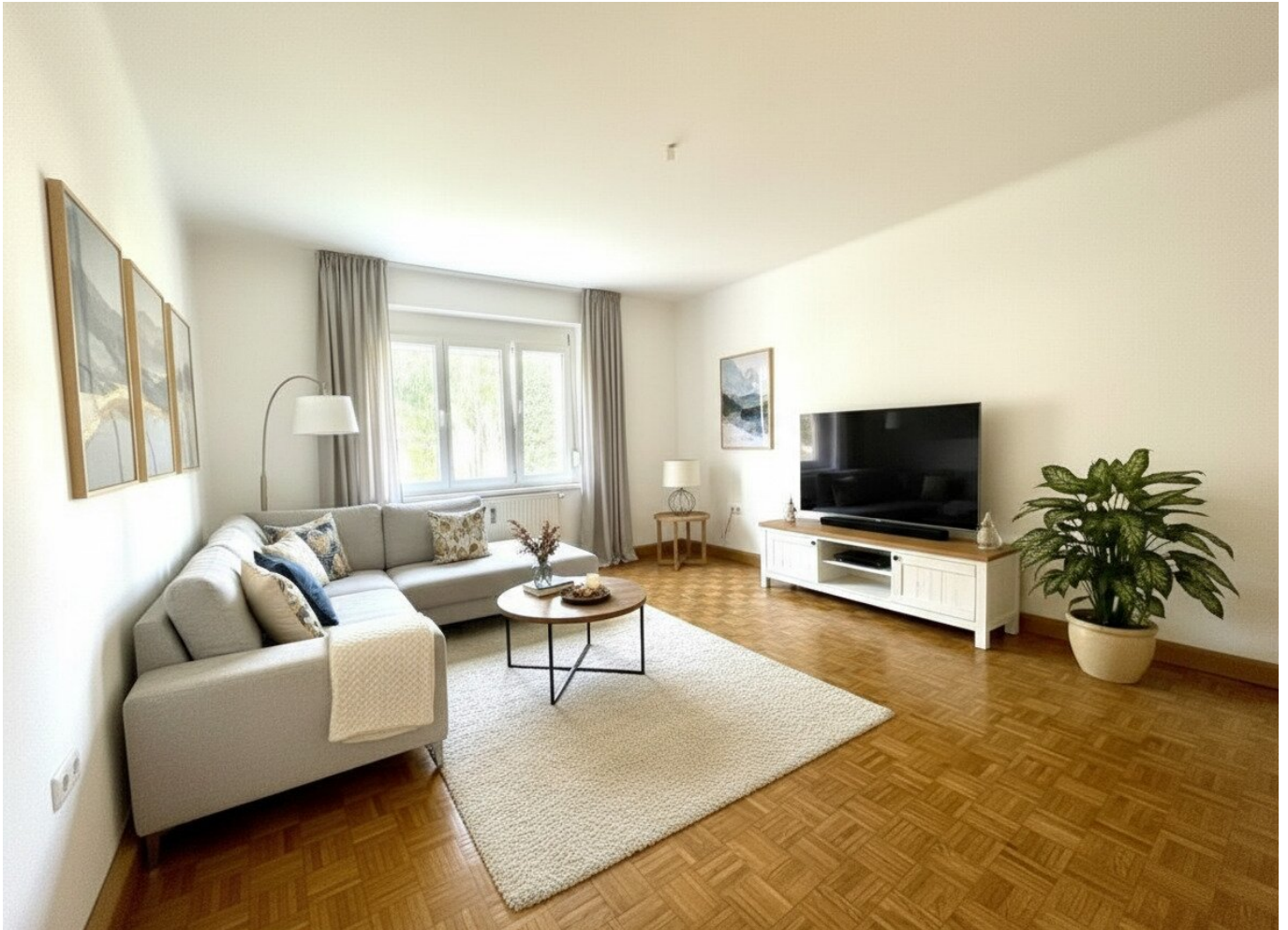
Wohnzimmer - mögliche Einrichtung