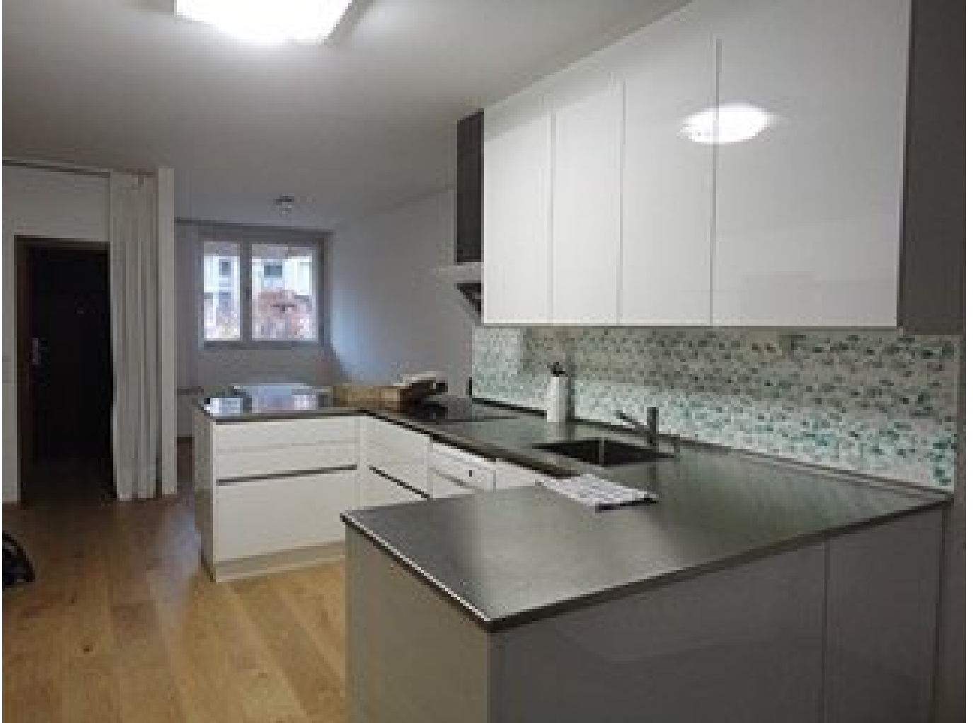
1 Küche_St. Peter Ha