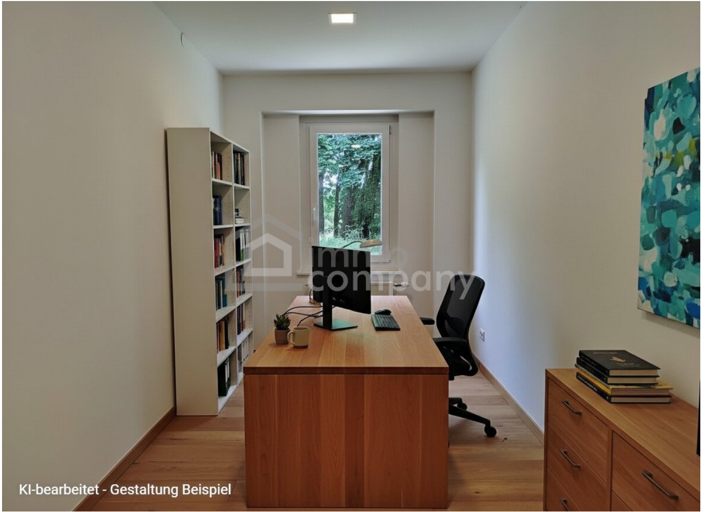
KI-bearbeitet - Gestaltung Beispiel