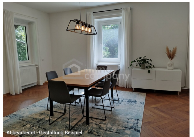
KI-bearbeitet - Gestaltung Beispiel