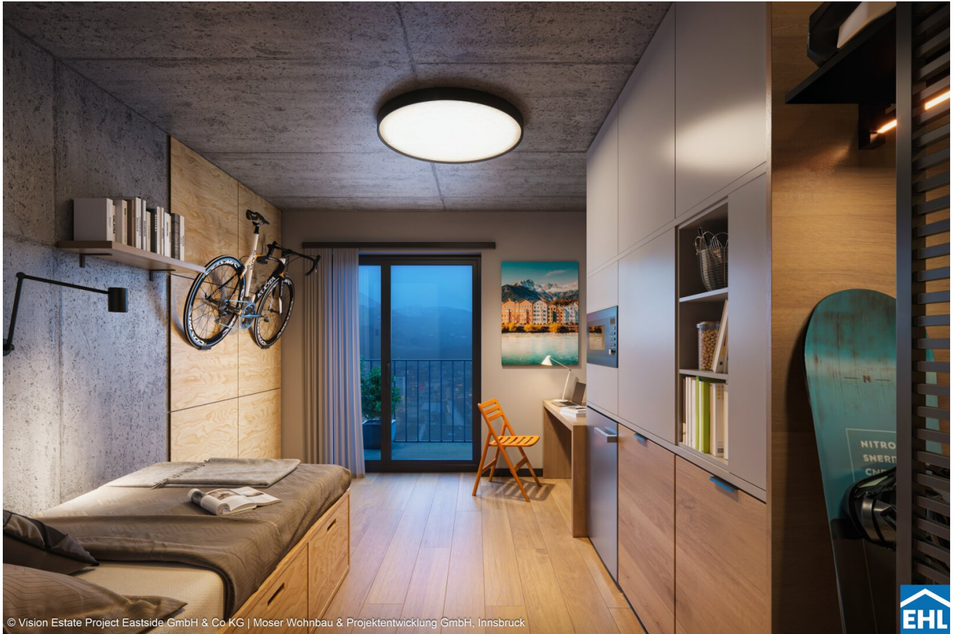
© Vision Estate Project Eastside GmbH & Co KG | Moser Wohnbau & Projektentwicklung GmbH, Innsbruck