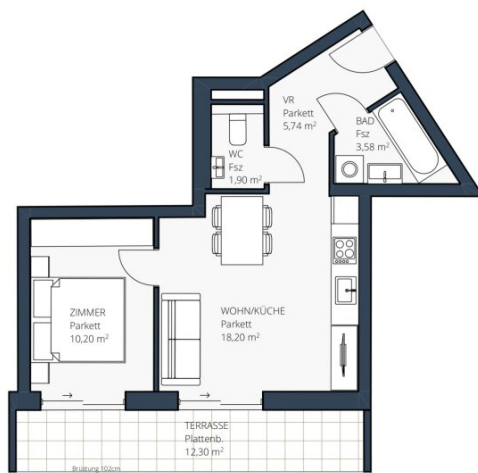
TOP 7 - 1. DG