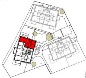
Übersicht 1. Obergeschoss M=1 : 1250