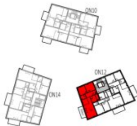
Übersicht 2. Obergeschoss M=1 : 1250