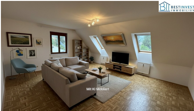
Mit KI Möbliert