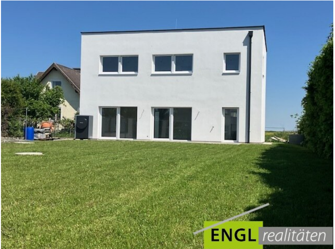
Haus mit Garten