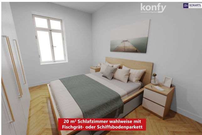
20 m² Schlafzimmer wahlweise mit Fischgrät- oder Schiffsbodenparkett