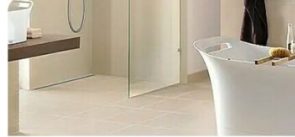
FLIESEN | Beige