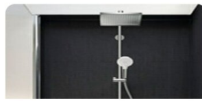
REGENDUSCHE | Hans Grohe