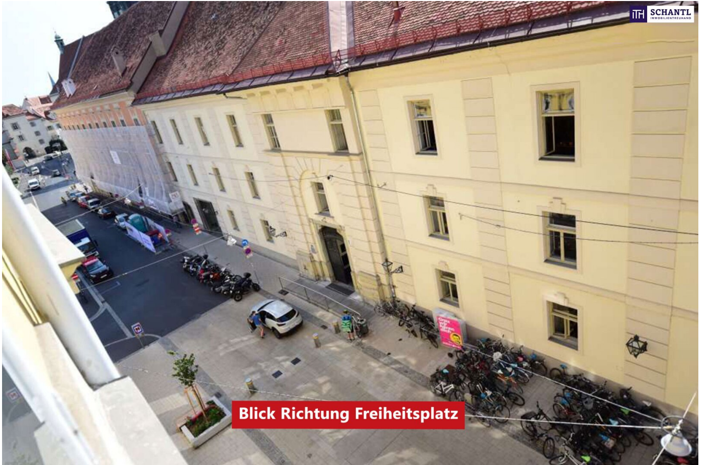
Blick Richtung Freiheitsplatz