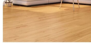
VINYL | Classen