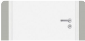
INNENTÜR | Weiß