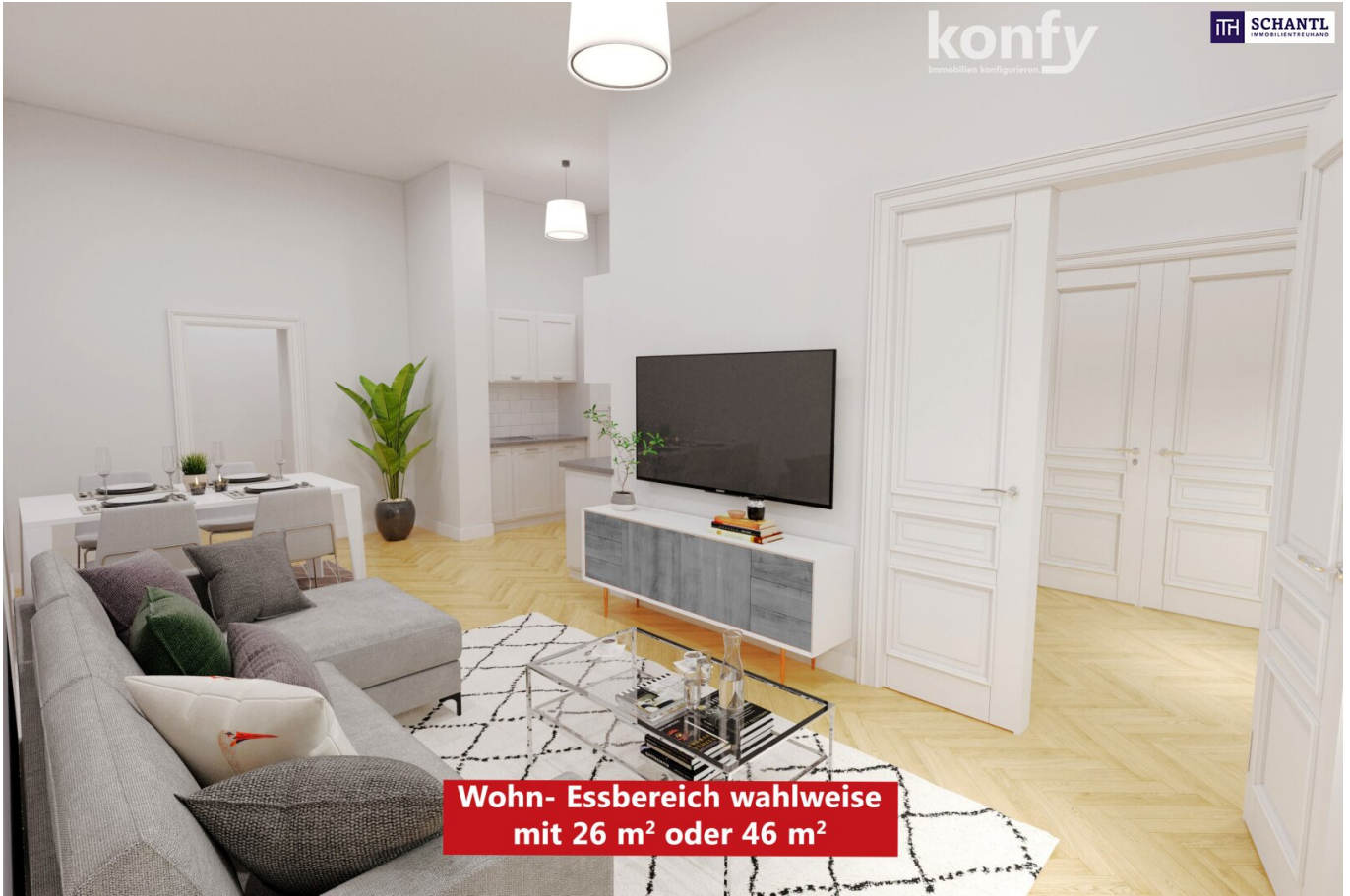
Wohn- Essbereich wahlweise mit 26 m 2 oder 46 m 2