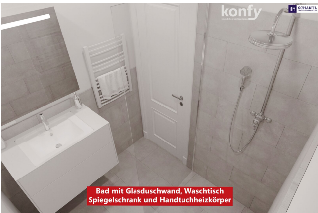
Bad mit Glasduschwand, Waschtisch Spiegelschrank und Handtuchheizkörper