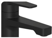
ARMATUR | Black