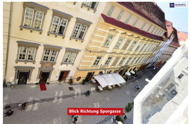
Blick Richtung Sporgasse