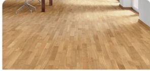
PARKETT | Eiche