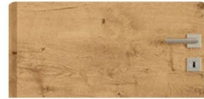
RÖHRENSPAN | Eiche