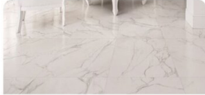
FEINSTEINZEUG | Marmor