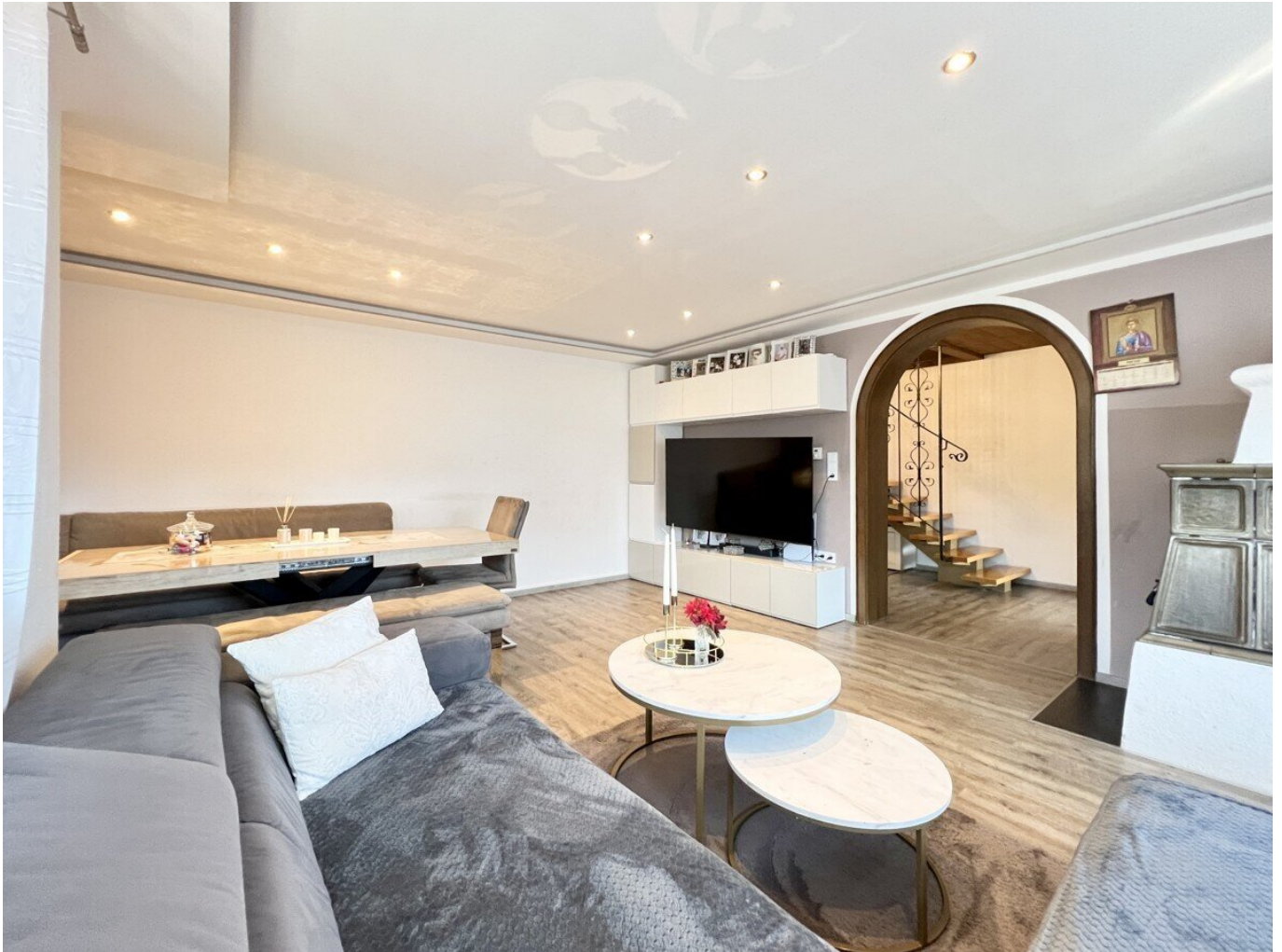
Wohn-Esszimmer mit gemütlichem Kachelofen und Zugang auf den Balkon