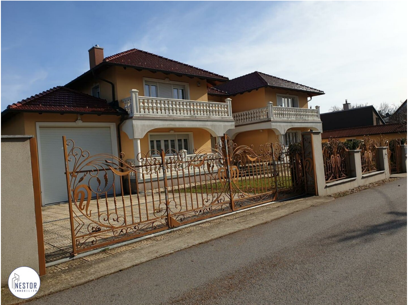
Villa - NESTOR Immobilien