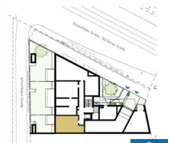
ORIENTIERUNGSPLAN | +0 ERDGESCH.

2025.03.11 | D02 WOHNUNGSPLAN | DS104_A00_PP_X