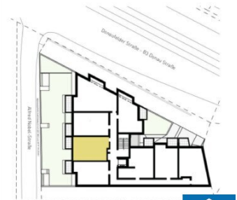
ORIENTIERUNGSPLAN | +3 OBERGESCHOSS

2025.03.11 | D02 WOHNUNGSPLAN | DS104_A00_PP_X