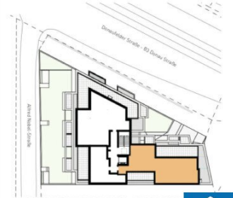
ORIENTIERUNGSPLAN | +4 DACHGESCHOSS

2025.03.11 | D02 WOHNUNGSPLAN | DS104_A00_PP_X