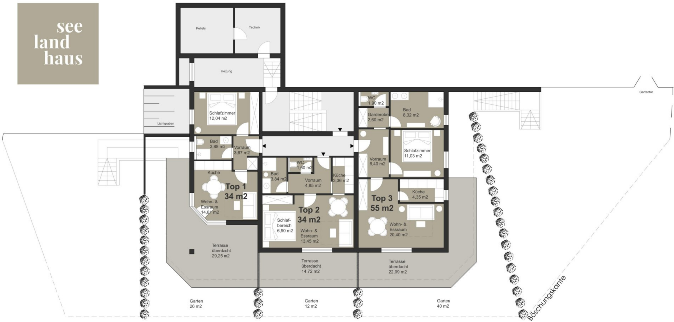
ERDGESCHOSS Top 1, Top 2, Top 3