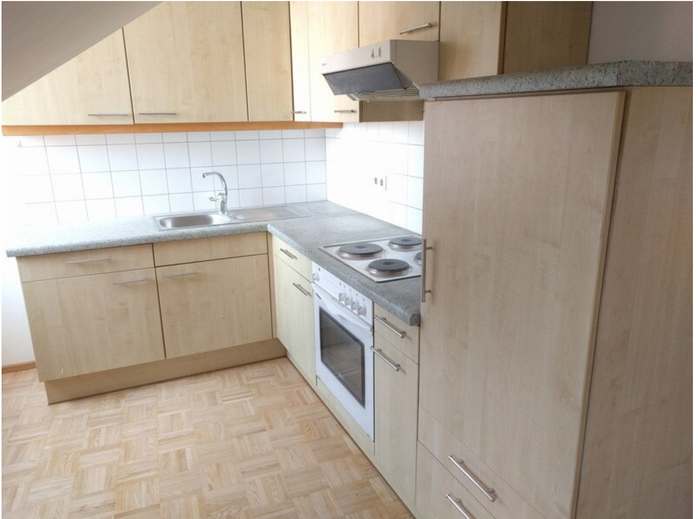
3 Küche Grabenstr T2