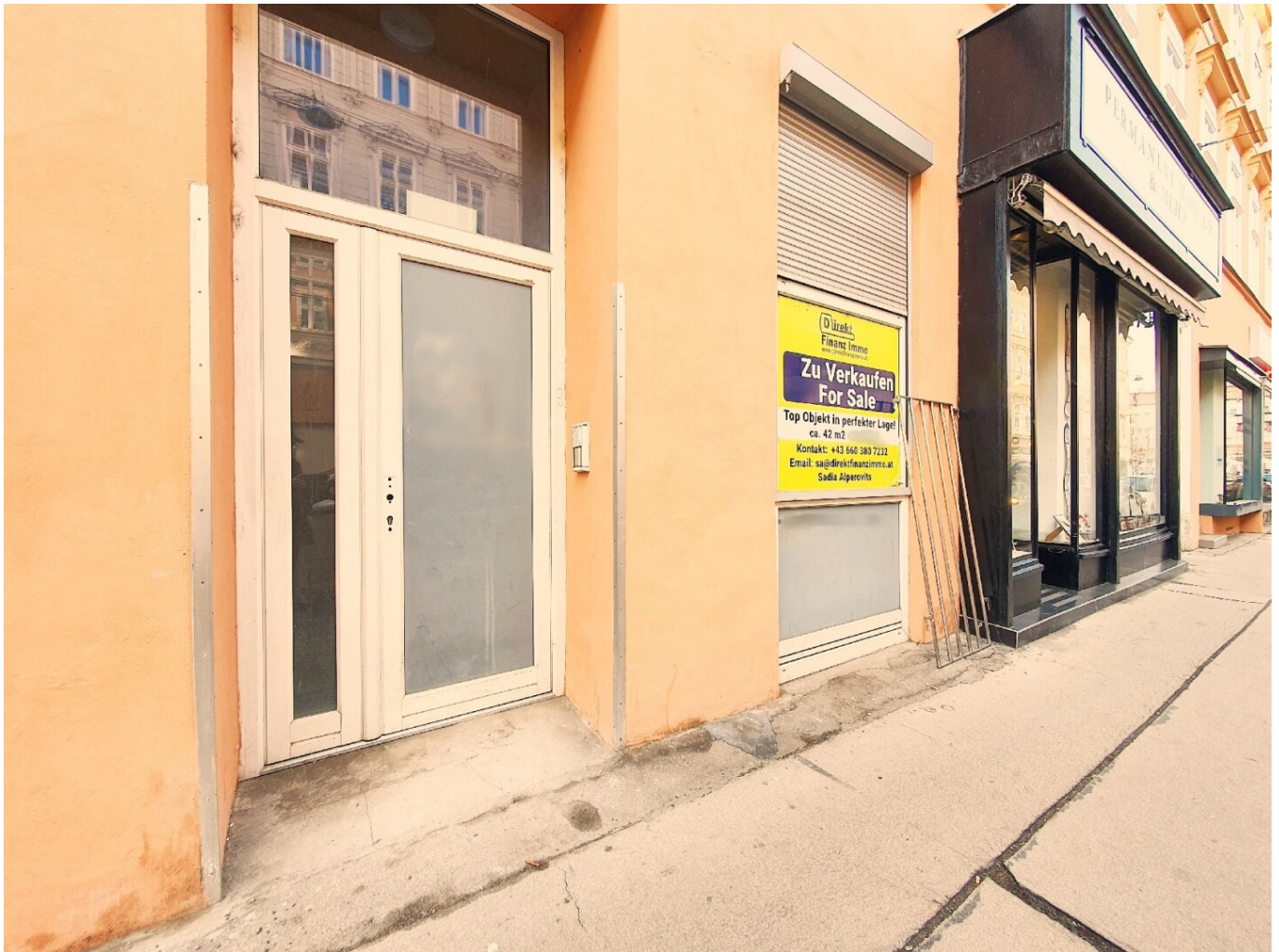
Straßenansicht (großer Portal nach Abstimmung mit MA möglich)