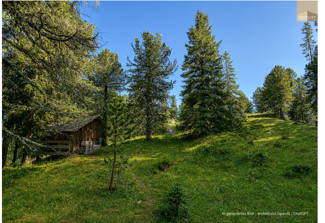
KI-generiertes Bild - erstellt mit OpenAI / ChatGPT