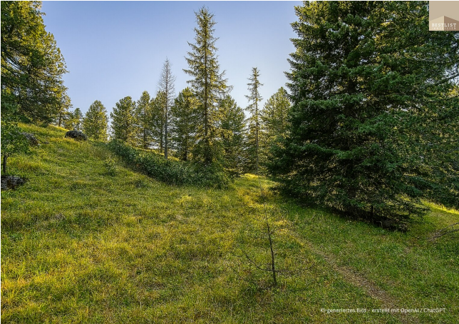
KI-generiertes Bild - erstellt mit OpenAI / ChatGPT