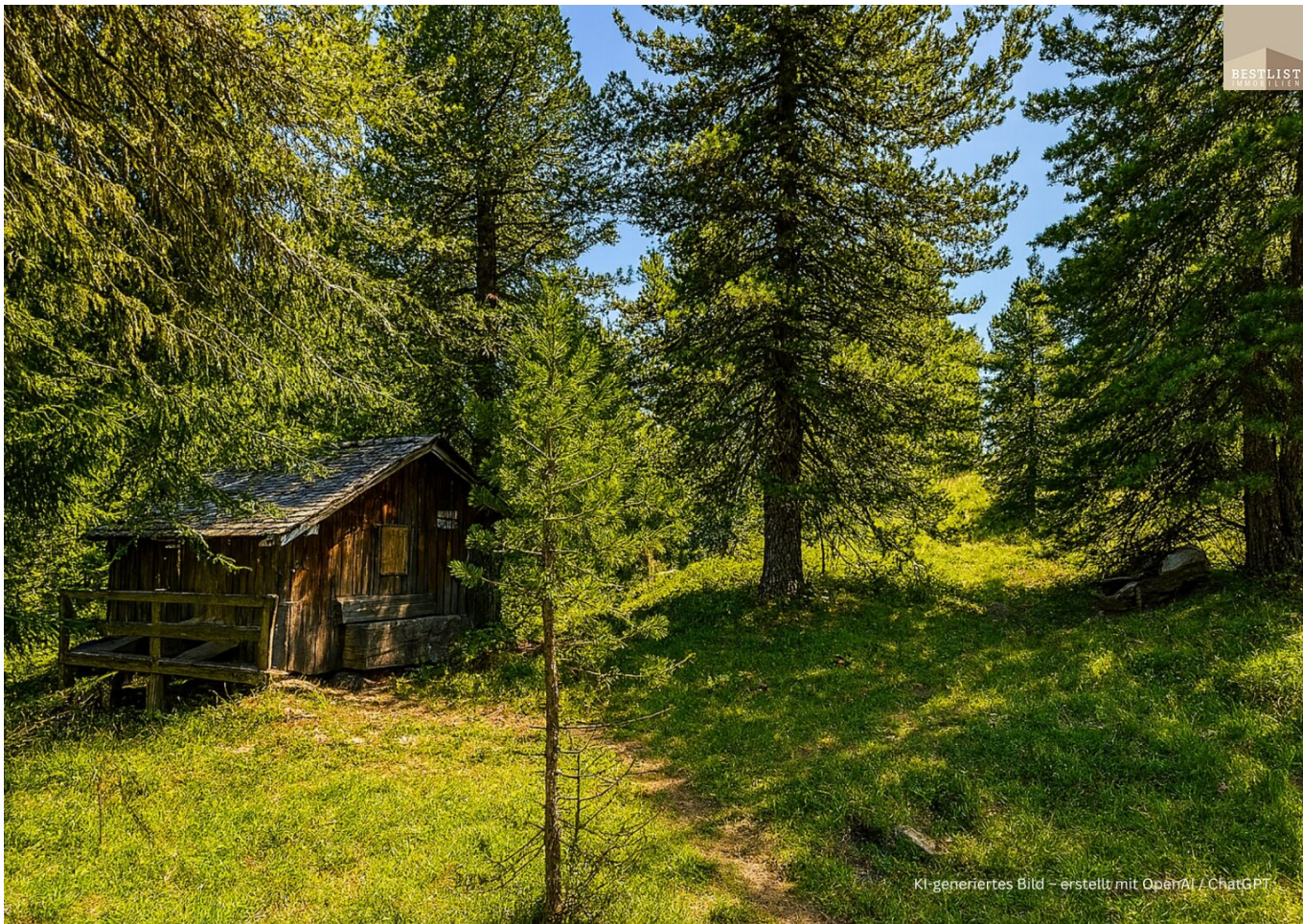
KI-generiertes Bild - erstellt mit OpenAI / ChatGPT