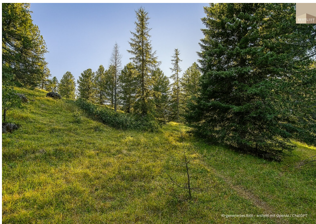
KI-generiertes Bild - erstellt mit OpenAI / ChatGPT