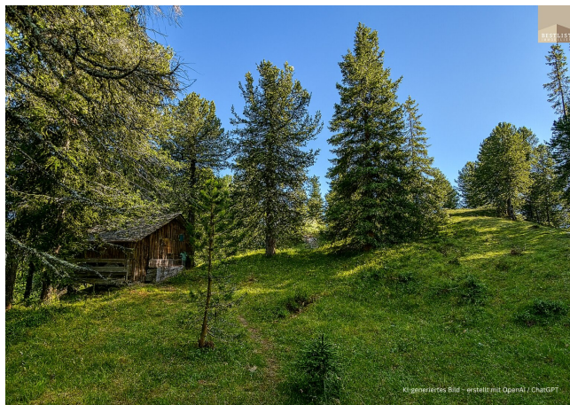
KI-generiertes Bild - erstellt mit OpenAI / ChatGPT