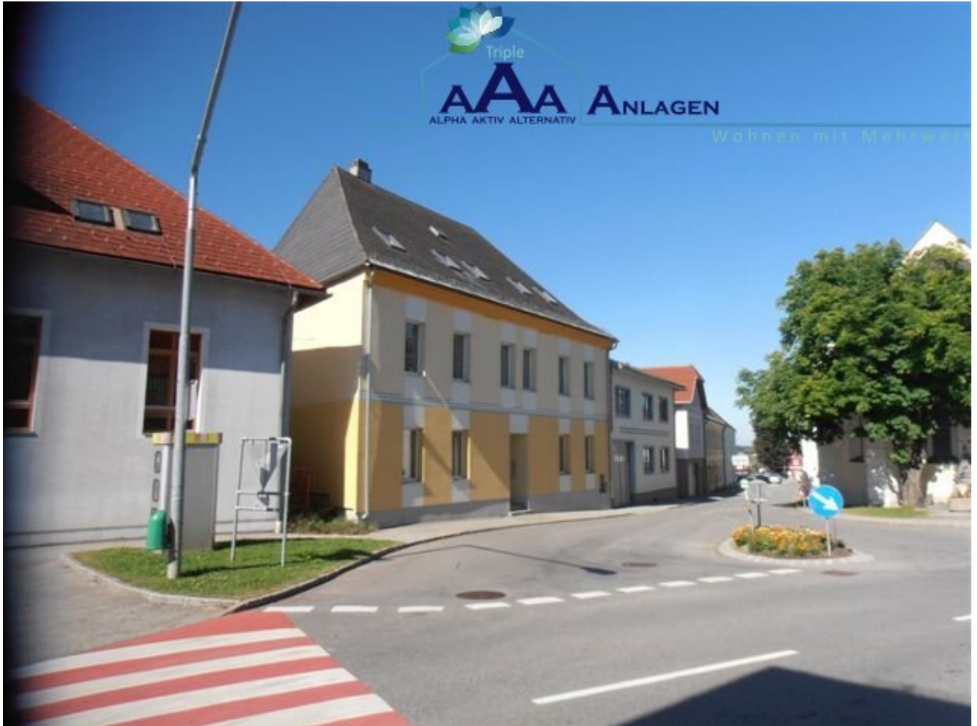
Hausansicht Oberer Markt