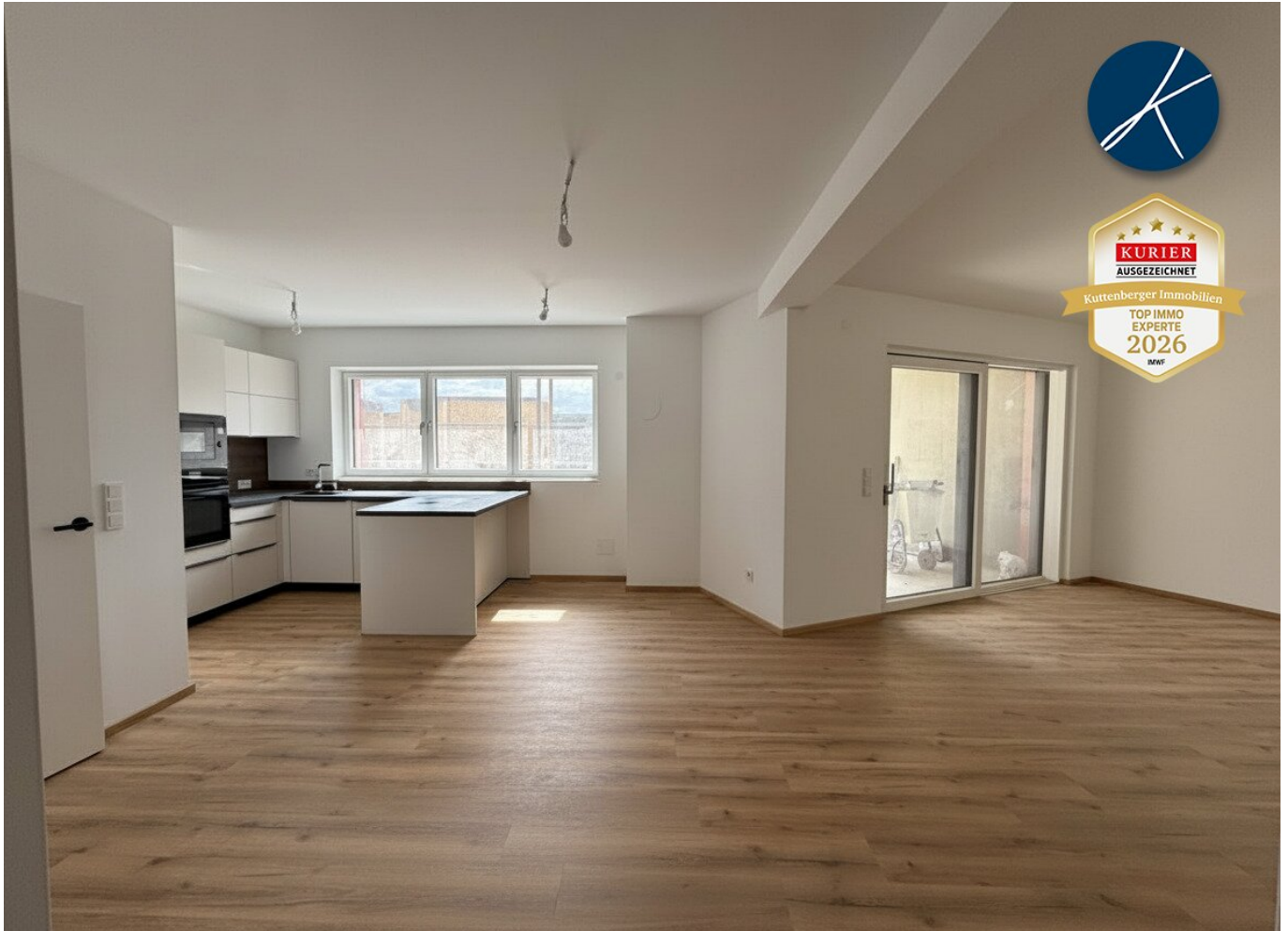
Bsp. Küche Top 2