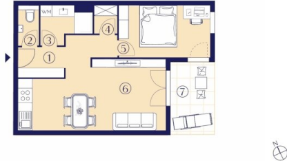
TYP 1 2 Zimmer – 48-56 m 2

Um die vielfältigen Bedürfnisse unserer Bewohner:innen zu erfüllen, präsentieren wir eine umfassende Auswahl an Wohnungsgrundrissen. Innerhalb dieser Vielfalt lassen sich zwei wesentliche Grundrisstypen erkennen: Typ 1 umfasst kompakte 48-56 m 2 mit 2 Zimmern, während Typ 2 großzügige 68-81 m 2 mit 3 Zimmern bietet. Unabhängig von der gewählten Wohnung steht jeder/m Bewohner:in eine eigene Freifläche zur Verfügung – ein zusätzlicher Raum für Entspannung und Erholung im Freien.