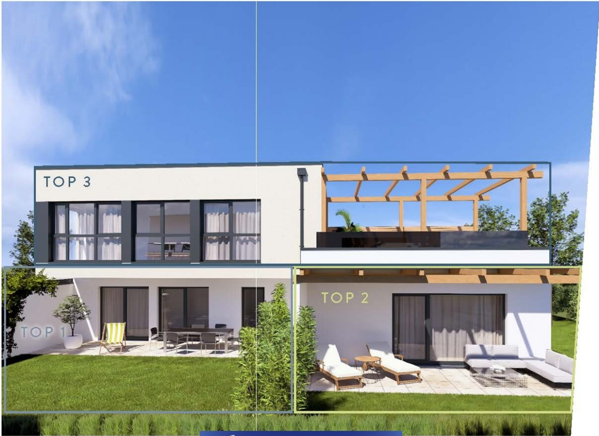
Bilder enthalten Sonderausstattungen und dienen nur als Illustration. Die tatsächliche Ausstattung ist in der Verkaufsprospektur zu finden.