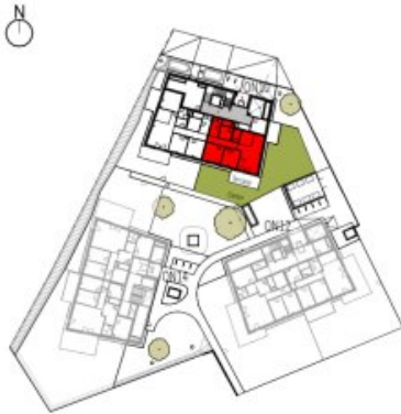
Übersicht Erdgeschoss M=1 : 1250