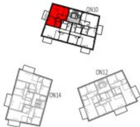
Übersicht 2. Obergeschoss M=1 : 1250