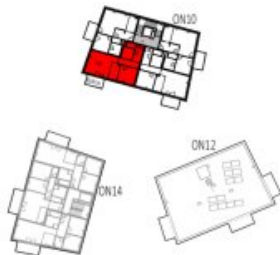
Übersicht 3. Obergeschoss M=1 : 1250