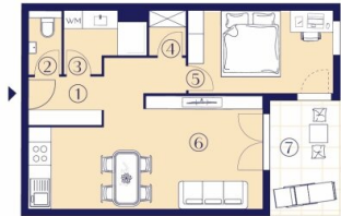
TYP 1 2 Zimmer – 48-56 m 2