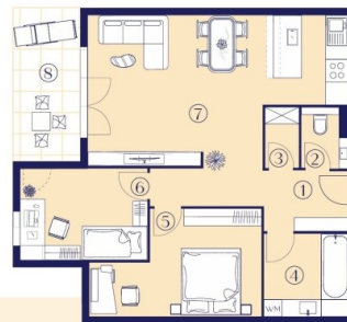
TYP 2 3 Zimmer – 68-81 m 2

Intelligente Grundrisse in der Architektur bilden die Grundlage für erfolgreiche Wohnkonzeptionen.