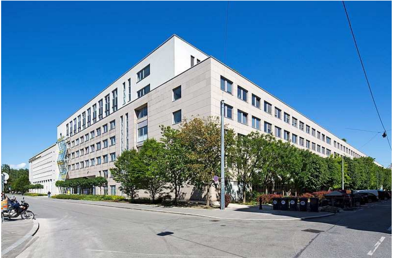
Außenansicht BT F