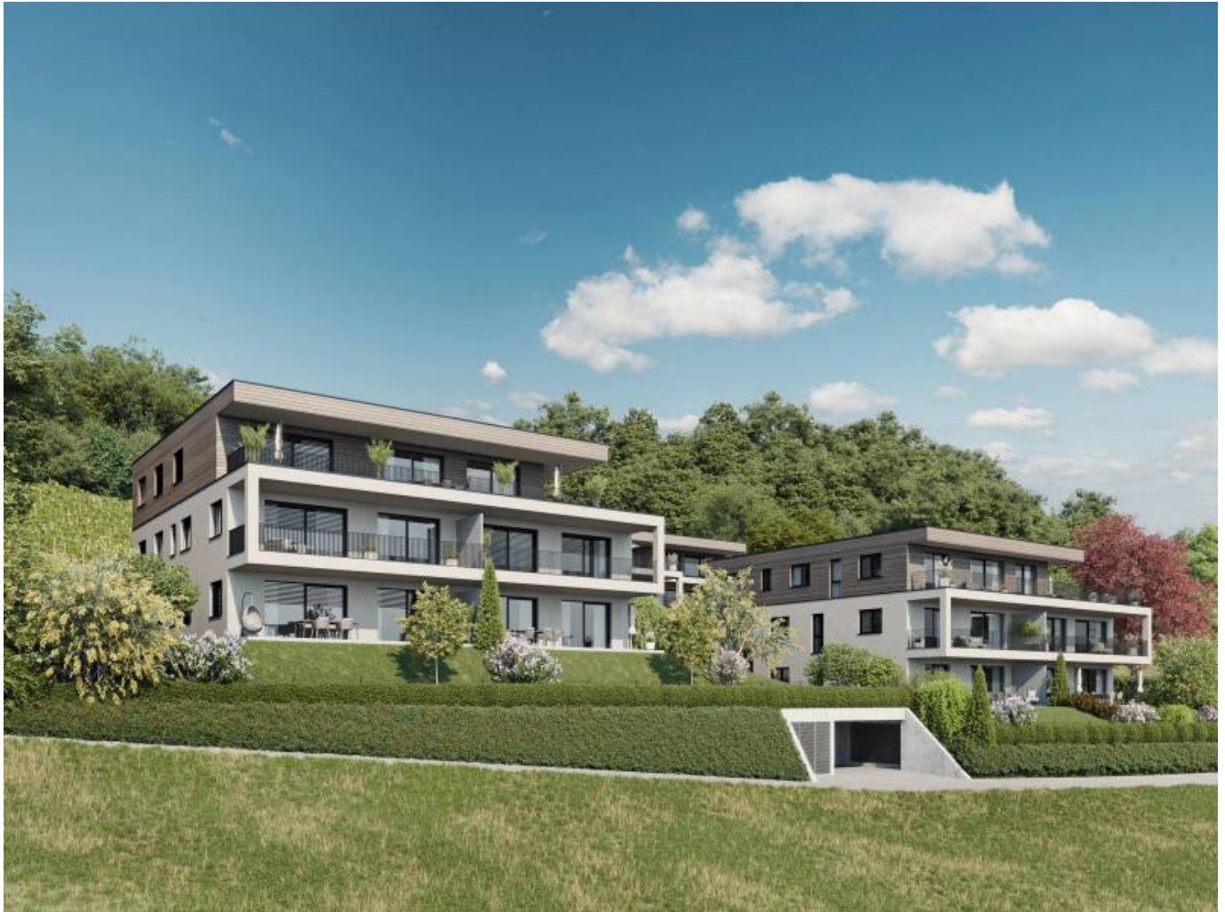
Haus A + B