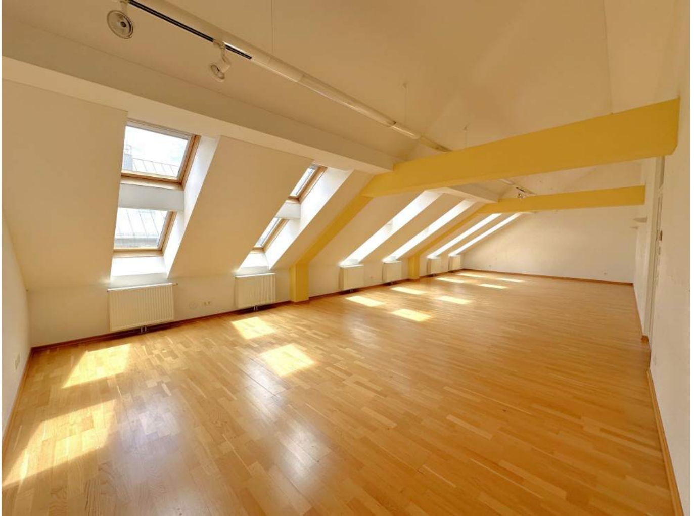
DG Raum (1)