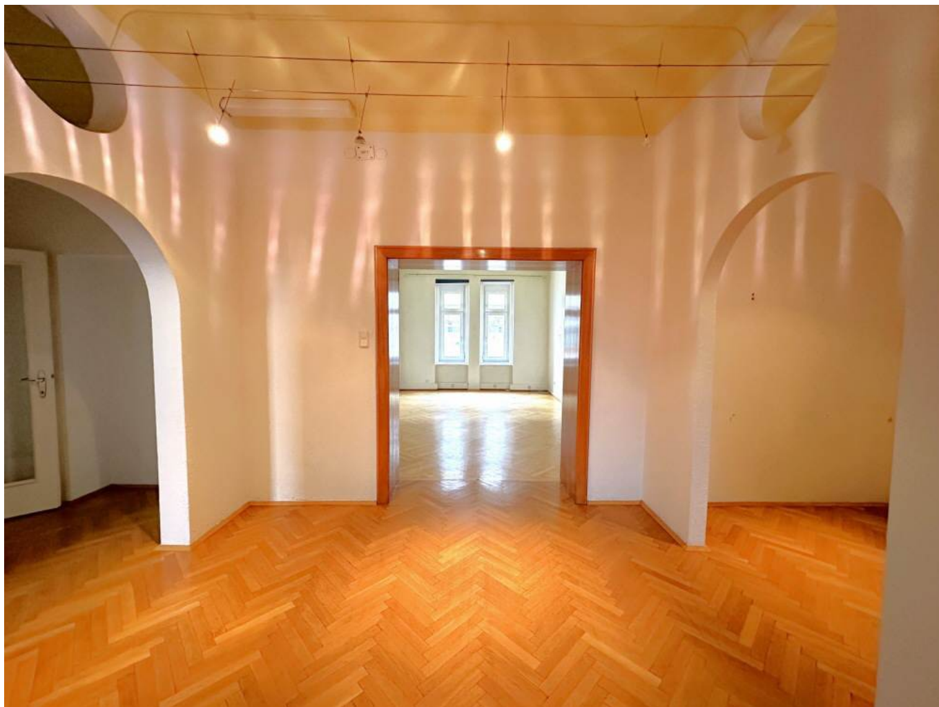
1.OG Vorraum (2)