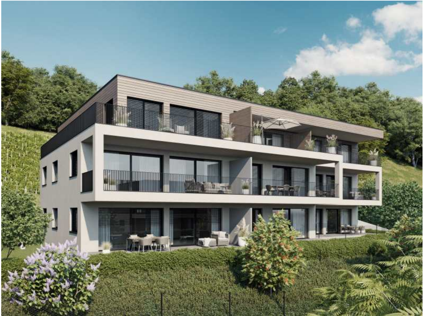
Haus - C