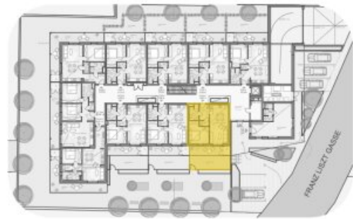
LAGEPLAN ERDGESCHOSS M 1:800