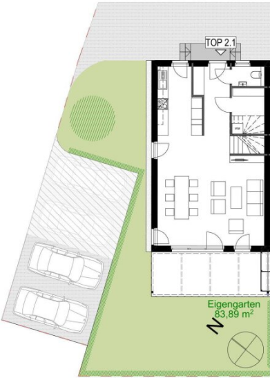
Erdgeschoss TOP 2.1