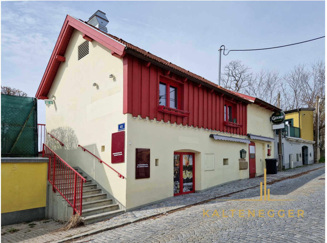
Restaurant von der Straßenansicht