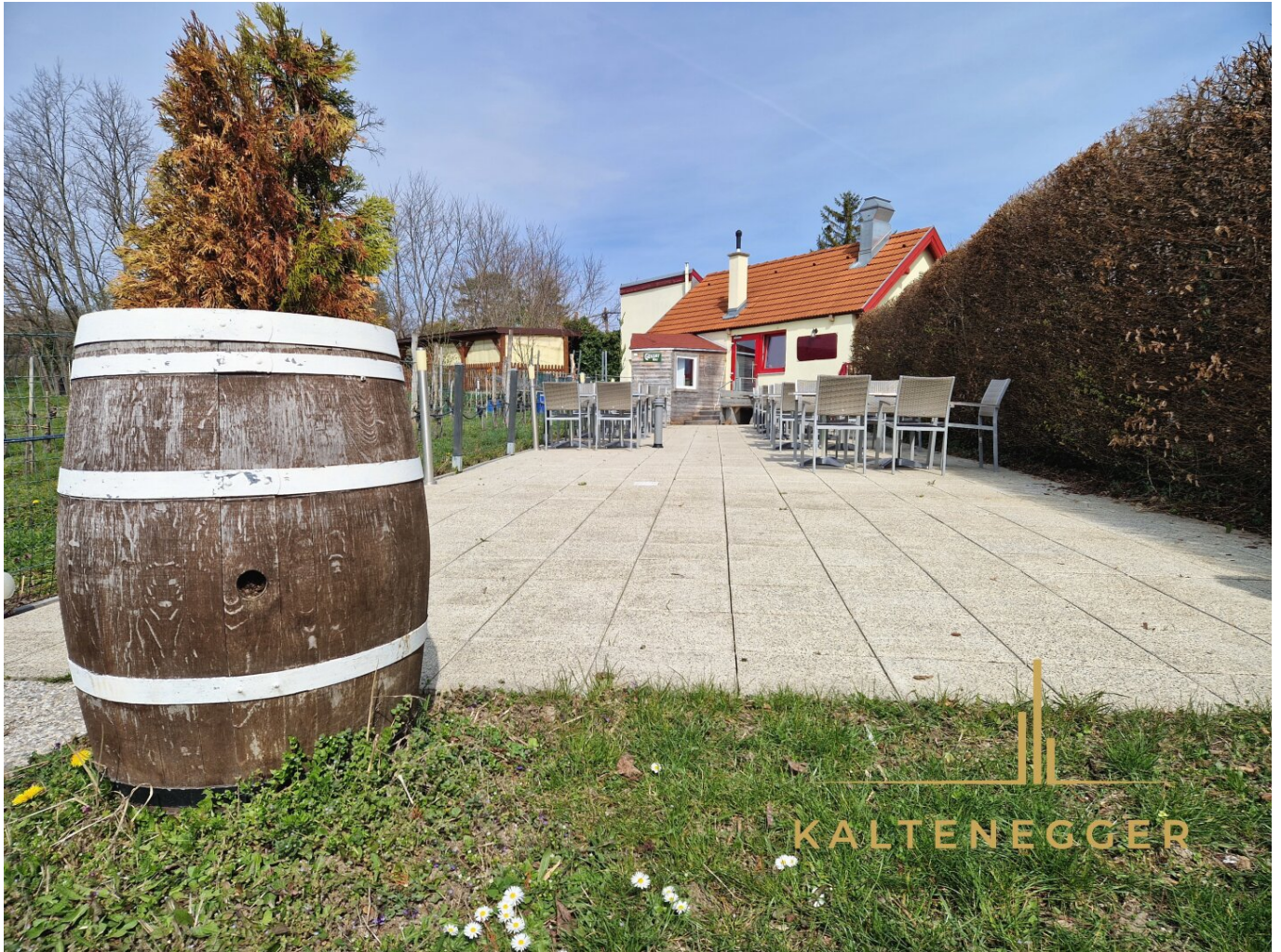
Hinteransicht: Terrasse mit Restaurant