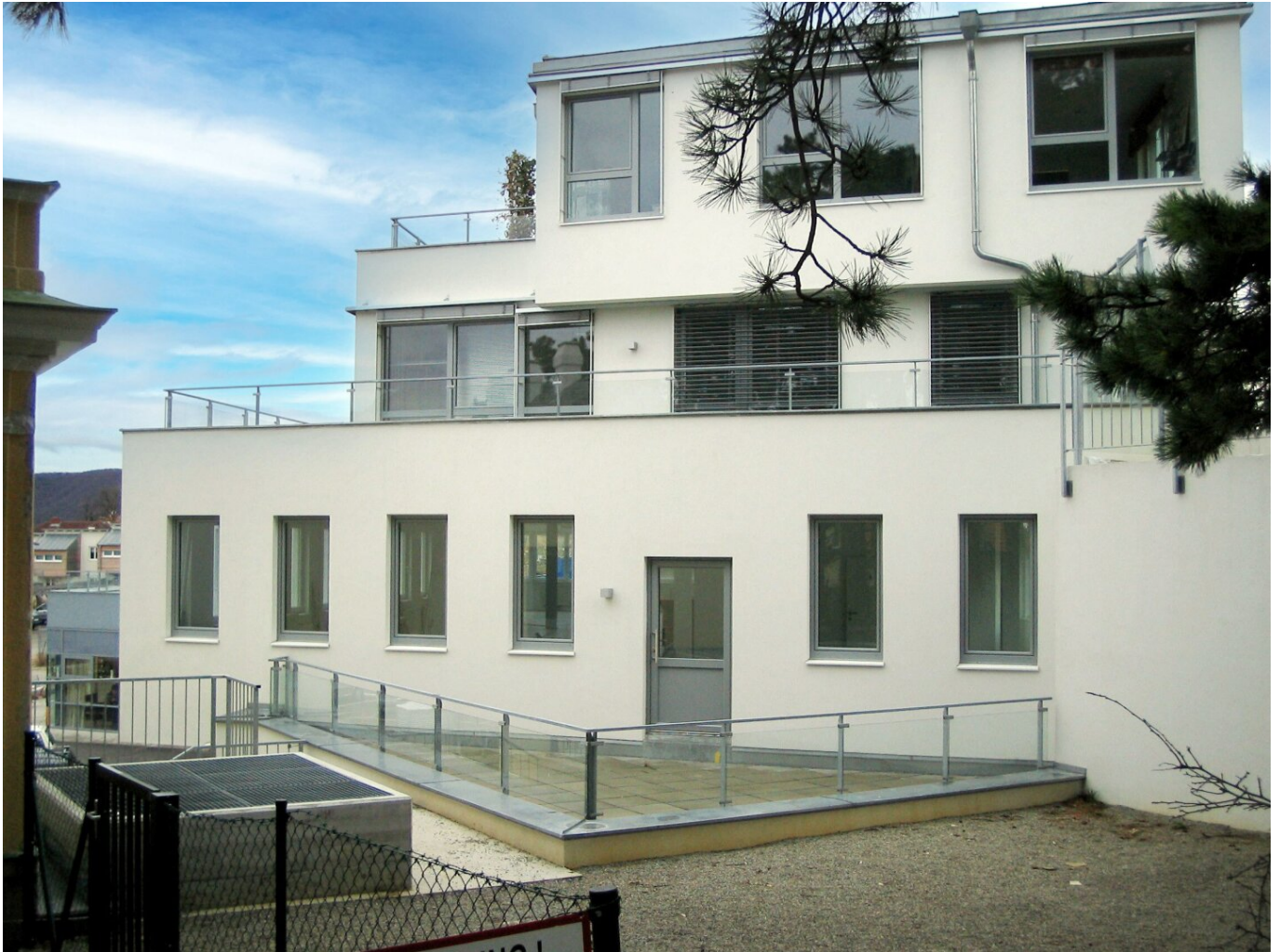
Büro mit Terrasse

Miete € 10,--/netto im Monat: 139m 2 super gelegenes Büro auch als Wohnung oder Praxis nutzbar mit großer Terrasse