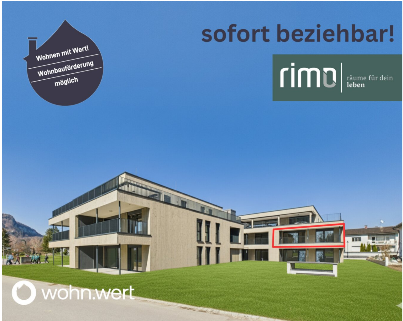
Titelbild - Top A8