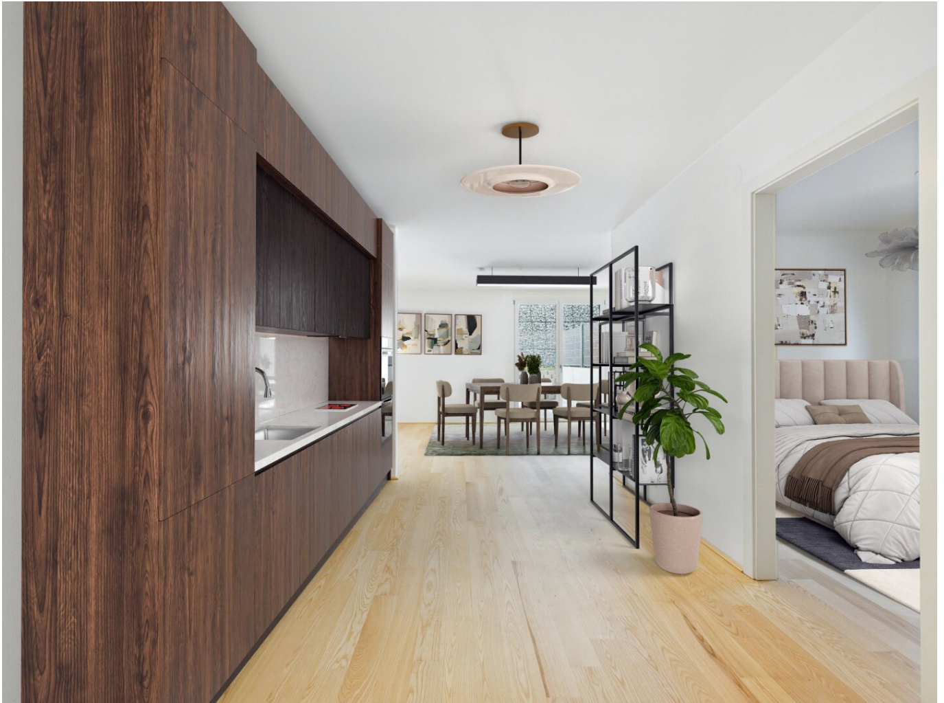
Wohnküche, Digital Staging