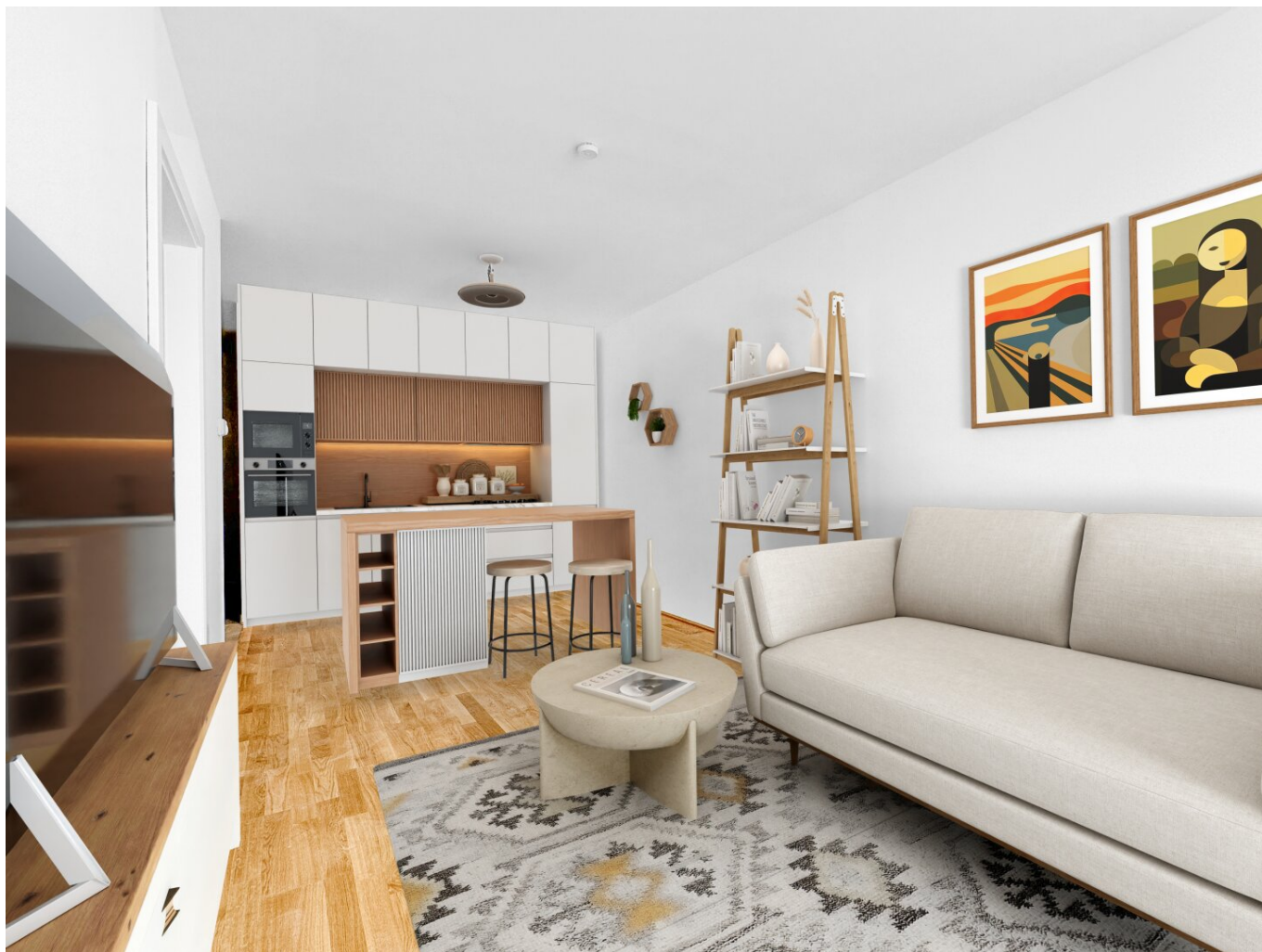
Wohnküche - Digital Staging