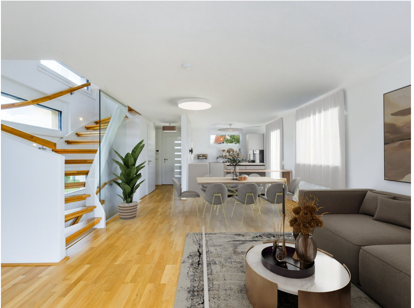
Wohnküche - Digital Staging