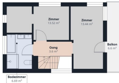
Stock 1 Gebäude 1

Ungefähre Gesamtfläche (1) 140,97 m 2 Balkone und Terrassen 6,6 m 2